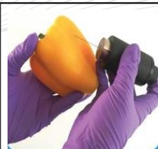
尖端光電獨步全球