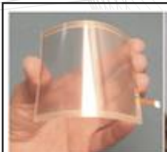
世界級化工新穎材料