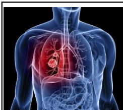
前瞻生技醫療技術