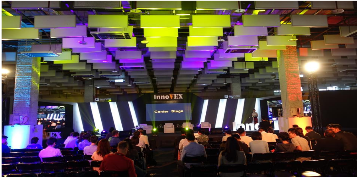
圖一：臺北世界貿易中心展覽三館之新創特區（InnoVEX）