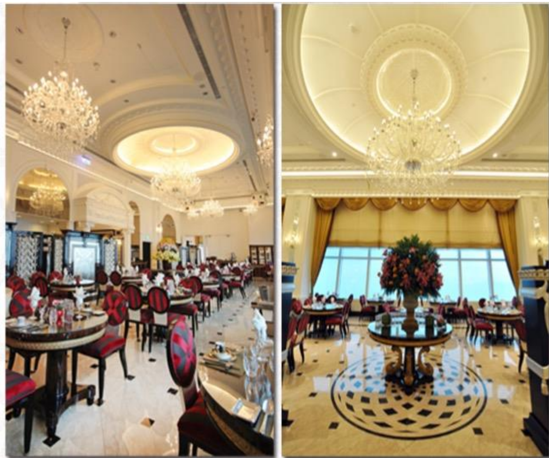
圖二：5月31日 O2O 高峰會晚宴場地：頂鮮 101