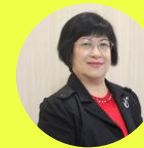
教育部青年發展署 署長 陳雪玉