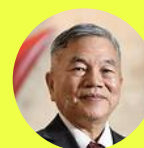
總統府資政 沈榮津