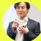
資策會董事長黃仲銘