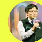
勞動力發展署雲嘉南分署 分署長 劉邦棟