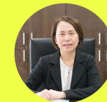
南科管理局局長 鄭秀絨