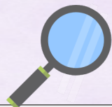
範例：專精課程-課程表