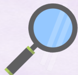
範例：共通核心職能課程-課程表