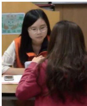
▲就服員駐點服務民眾(示意圖，非故事本人)

為增加15至29歲青年就業機會，新北市推動辦理「青年就業旗艦計畫」，結合產業資源，提升事業單位僱用青年之意願，提供青年務實致用之職業訓練以培養職場實戰力。